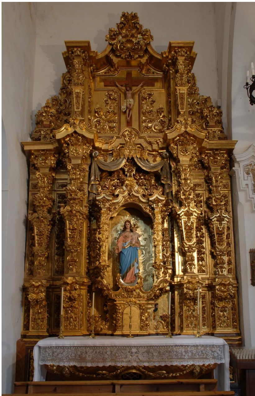
Retablo de la Virgen del Rosario, Parroquia El Salvador

Tal es la devoción que existía, que en la Parroquia El Salvador tenemos un retablo dedicado a la Virgen del Rosario construido en el siglo XVIII.