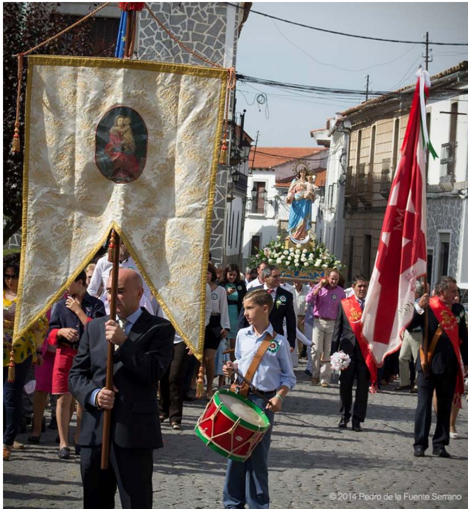
10 de octubre de 2014