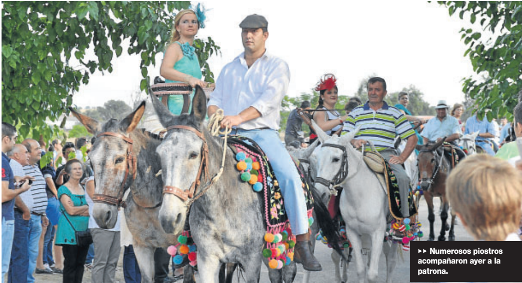
►► Numerosos piostros acompañaron ayer a la patrona.

La Virgen de Piedrasantas fue trasladada ayer por la tarde desde la parroquia de El Salvador de Pedroche hasta su ermita, acompañada de más de 400 piostros o romeros a caballo, cuya estampa más típica es la del hombre a caballo o yegua sobre mantas y, tras él, la mujer sentada en jamuga con su paje en una yunta de mulas. Como en otras ocasiones, este año ningún vecino solicitó ser mayordomo, por lo que fue el Ayuntamiento quien asumió esa función.