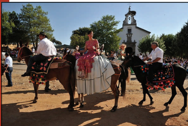
Las tres figuras de Los Pioستros: el hombre a caballo, la mujer y el paje, sobre mulas.

Cada año, el día 7 de septiembre por la tarde se reúnen los Pioستros en la puerta de la casa de uno de los mayordomos, recorren las calles del pueblo para buscar, si la hubiera, a una segunda persona que "sirva" a la Virgen, y después se dirigen a la parroquia El Salvador para recoger la imagen de la Virgen de Piedrasantas. A continuación emprenden el camino de la ermita, a orillas del arroyo Santa María, a unos dos kilómetros de Pedroche .