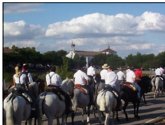
Camino de la ermita de Piedrasantas

Algunos aspectos que se mantienen en el desarrollo de la fiesta nos evocan unas relaciones sociales ya desaparecidas, cuyos orígenes se remontan a la Edad Media y que estuvieron vigentes durante toda la Edad Moderna. Además, la carrera subiendo la llamada Cuesta del Molar tiene claras reminiscencias de antiguas carreras de caballos medievales y renacentistas.