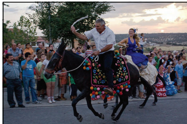
En plena carrera en la "Cuesta del Molar"

Una vez que se llega al santuario, uno a uno, todos los caballistas, pasan delante de la Virgen de Piedrasantas saludándola. Se oficia una misa y jinetes y autoridades son invitados a un refrigerio. Antes de que se ponga el sol, los pioستros regresan al pueblo. A la llegada, en la llamada "Cuesta del Molar", se produce uno de los momentos más espectaculares de la fiesta. Los más atrevidos caballistas se lanzan en vistosas carreras mientras el numeroso público congregado aplaude con fuerza.