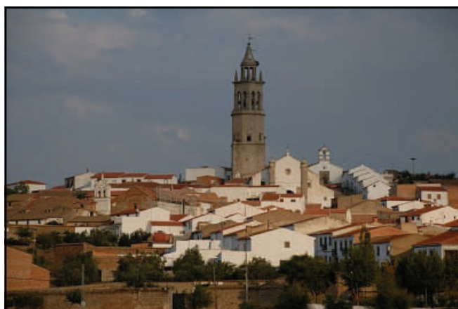
Imagen del pueblo de Pedroche

También sabemos que durante la baja Edad Media es cuando Pedroche será el germen del nacimiento de un grupo de aldeas que con el tiempo pasarían a denominarse las Siete Villas de los Pedroches, una comunidad rústica que englobaba a Pedroche como capital, Torremilano (Dos Torres), Torrecampo, Villanueva de Córdoba, Pozoblanco, Alcaracejos y Añora. Es por eso que da nombre a la comarca donde se sitúa, Los Pedroches.