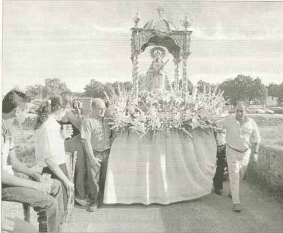
Procesión de Ntra. Sra. la Virgen de Piedrasantas por el puente sobre el arroyo de Santa María.