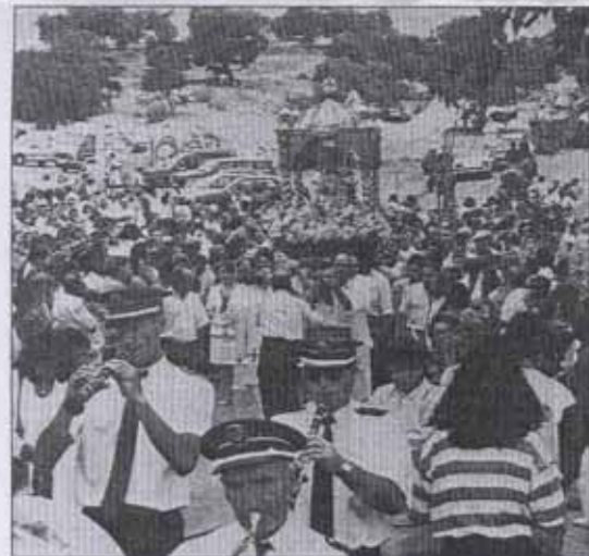
Numerosos jinetes y carrozas han participado en la romería.