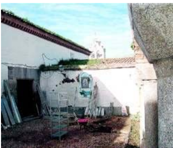
El edificio se encuentra muy deteriorado.